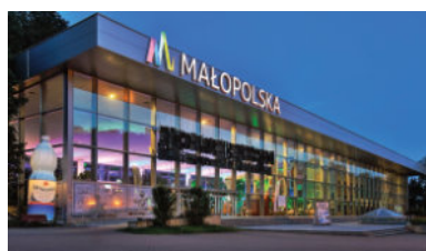
Pijalnia Wód Mineralnych