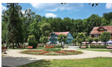
Spacer po Uzdrowisku