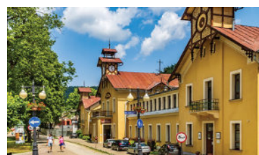
Stare Łazienki Mineralne