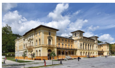
Stary Dom Zdrojowy